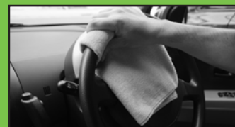
ハンドルに付いた手垢の拭き取りも