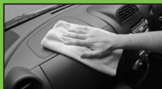
ダッシュボード等の樹脂の拭き取りも