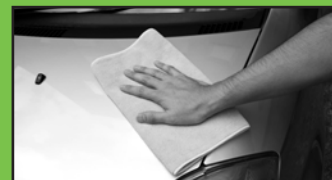
コーティングの時のウエスとしても