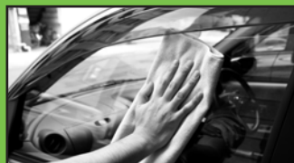
窓ガラスを拭いてもきれいに

やわらかくふわふわと感じるクロスは毛足が長くデリケートなメタリック車や黒パールの塗膜を拭き上げる際、キズが入りにくい構造となっています。超極細繊維で水拭きや乾拭きだけで簡単に汚れがとれるクロスです。