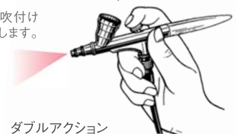
ダブルアクション